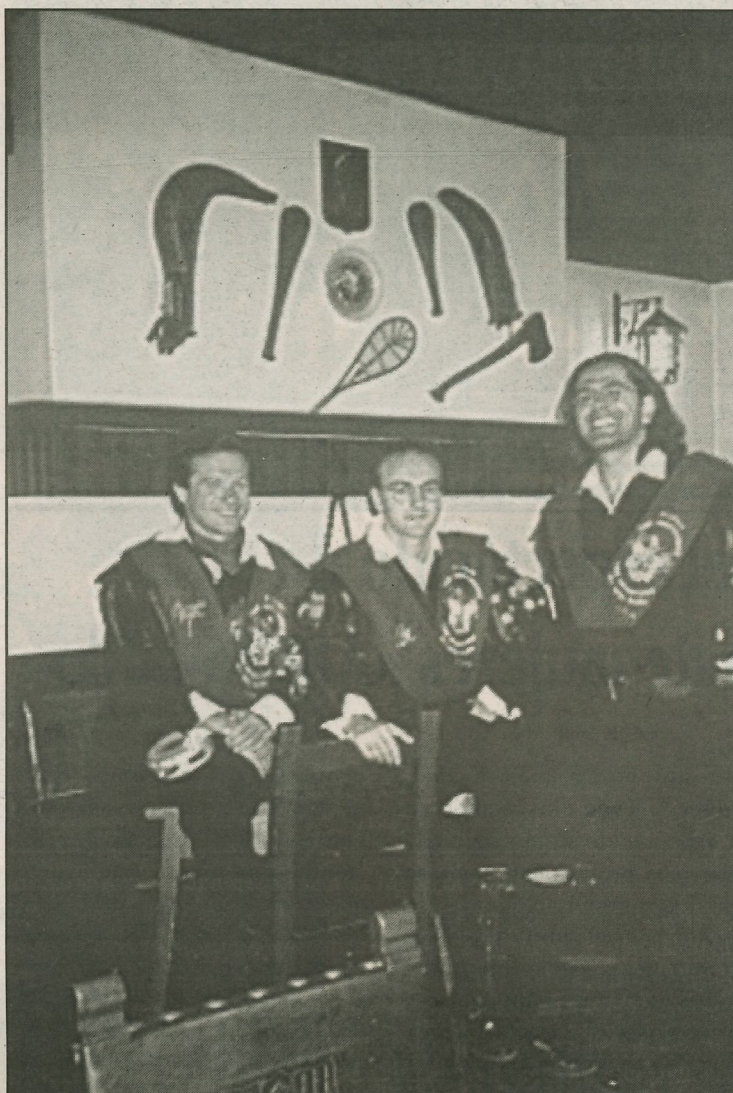
En el centro Alberto, en la Casa Vasca de Santiago de Chile

Hemos tenido que ampliar y cambiar nuestro repertorio, incluso hemos comprado cintas para aprender canciones nuevas.